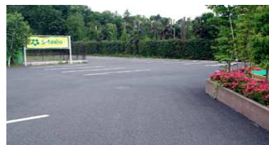
無料駐車場 40 台完備