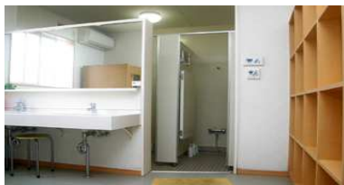
男女更衣室・トイレ完備