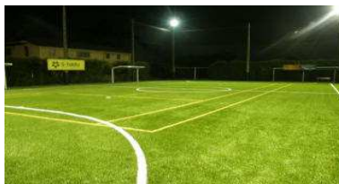
人工芝コート2面（ナイター完備）